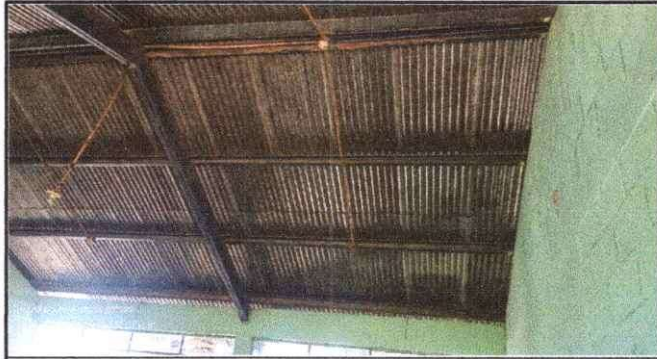
Foto1: Se observa el deterioro de las laminas portantes del modulo 1