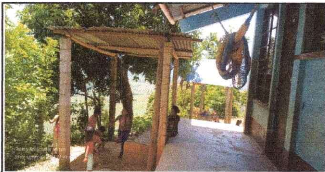
Foto 5: Se observa las láminas portantes de la cocina del modulo 3

Observación: Si es necesario se pueden agregar hojas adicionales y actualizar el número de hojas.