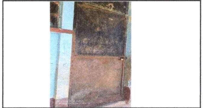
Foto 2: Se observa el deterioro de la puerta portante del modulo 1