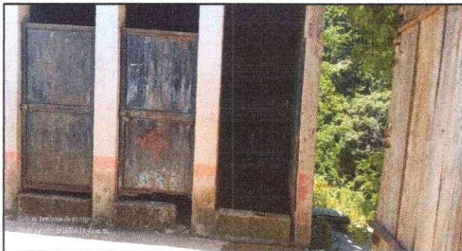
Foto 3: Se observa el deterioro de las puertas portantes del modulo de los baños.